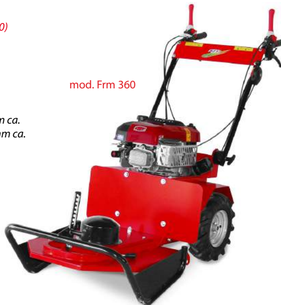
mod. Frm 360

Getriebe mit 3 Vorwärtsgänge und 1 Rückswärtgang