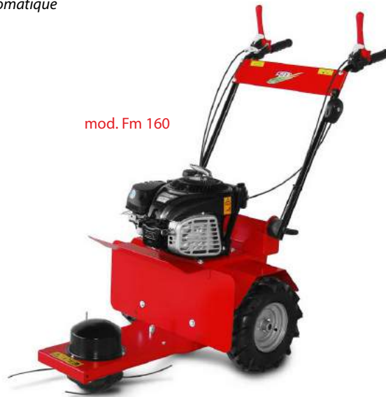
mod. Fm 160

(seulement pour frm 360) Boîte à vitesses a 3 vitesses avant et une vitesse en arriere