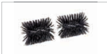
Cepillo de rodillos Código 68602002