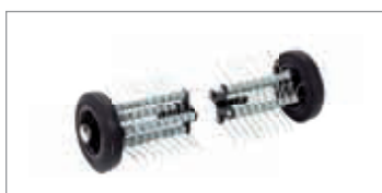
Aireador Código 68602003