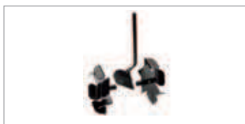
Reja Código 68602004