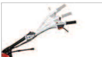
Manillar con regulación vertical para trabajar en la postura correcta.