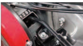
Selector de marchas externo, práctico y ergonómico.