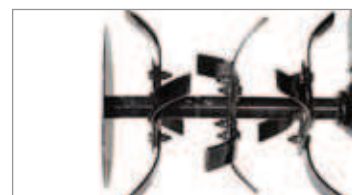
Fresa de 85 cm con discos laterales de protección.