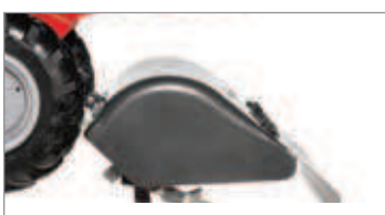
Fresa de 50 cm en contrarrotación que facilita el trabajo en suelos difíciles.