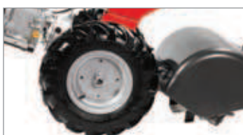
Ruedas de gran tamaño para mayor agilidad de maniobra.