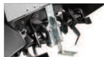
Regulación de la profundidad de la fresa para utilizarla en cualquier tipo de terreno.