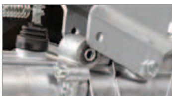
Manillar montado sobre soportes antivibración.