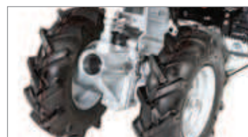
Conexión rápida QuickFit integrada que permite cambiar los aperos sin herramientas.