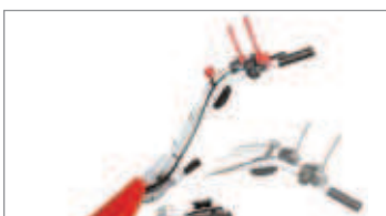
Manillar con regulación vertical para trabajar en la postura correcta.