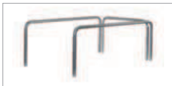
Extensión de las barandillas Código 68722003