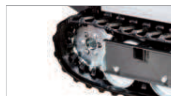
Frenos extensibles y protegidos para trabajos en condiciones extremas.