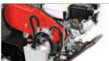
Distribuidor de palanca para mando del volteo hidráulico.