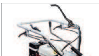
Dirección con desbloques y frenos independientes.